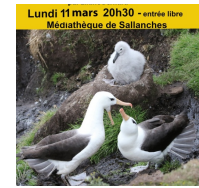
Lundi 11 mars 20h30 - entrée libre Médiathèque de Sallanches