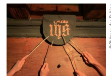
@Château des Rubins